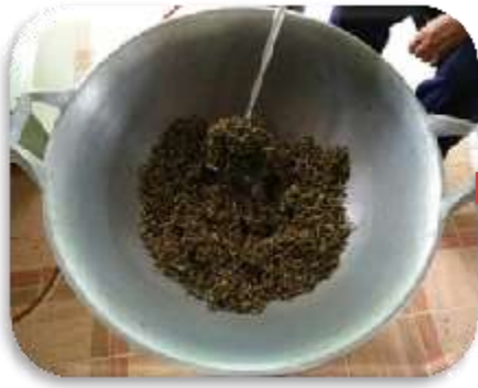
พรมมิเริ่มแห้งสนิทเปลี่ยนเป็นสีน้ำตาล