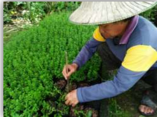
๓. ปักชำก้านพรมมิลงไปในถุงพลาสติกที่กรอกดินเตรียมไว้ สึกกลงไปในดิน ๒ ส่วน ใน ๓ ส่วน