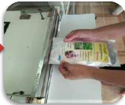
ขึ้นถุงบรรจุภัณฑ์ผลิตภัณฑ์