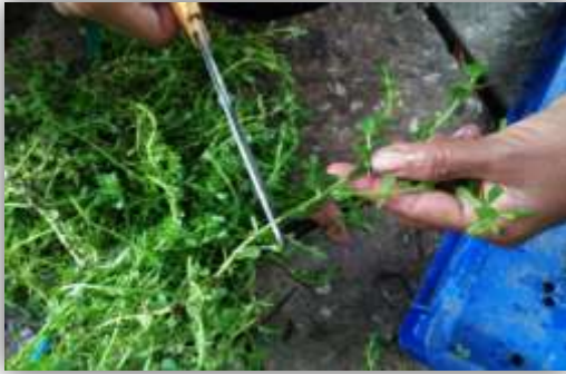
๑. คัดเลือกกิ่งพันธุ์