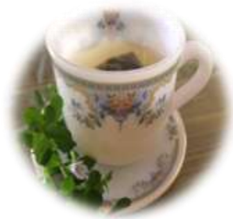
ชาพร้อมดื่ม