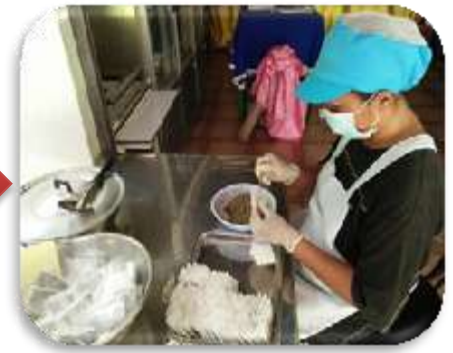
ผสมตามอัตราส่วนบรรจุของชา