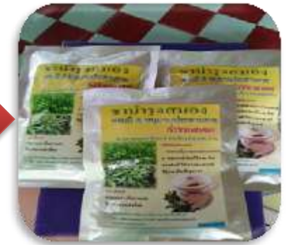
ผลิตภัณฑ์ชาพรมมิ บำรุงสมอง