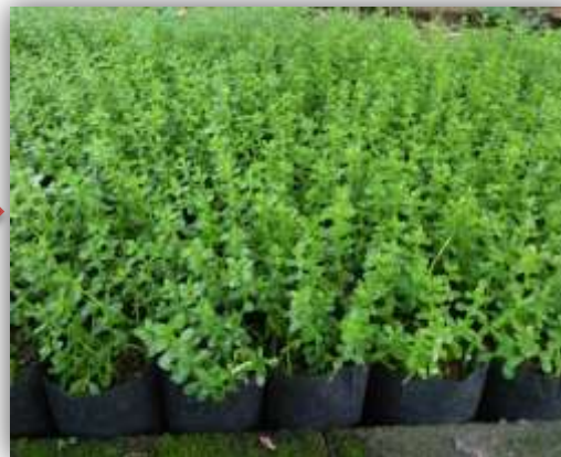
๕. พรมมิที่ปักชำ ๒ - ๓ สัปดาห์