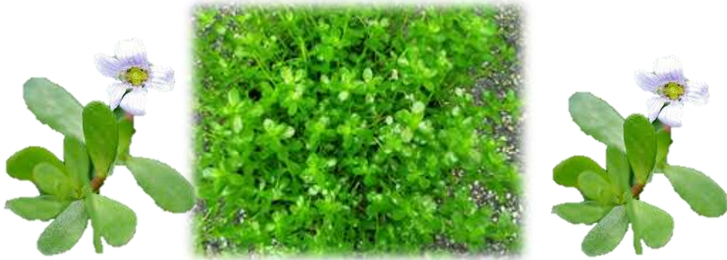
พรมมิ สมุนไพรเพิ่มความจำ บำรุงสมอง

พรมมิ หรือ ผักมิ ( Bacopa monnieri ) เป็นสมุนไพรที่มีการใช้ในการแพทย์อายุรเวทของอินเดีย มีสรรพคุณบำรุงความจำ บำรุงสมอง รักษาอาการไข้ รวมทั้งมีการใช้ในตำรายาไทยหลายตำรับ นอกจากนี้ยังมีการรับประทานเป็นผักพื้นบ้าน และเพาะปลูกง่ายเกิดในทุกภูมิภาคของประเทศ จึงจัดเป็นสมุนไพรที่มีศักยภาพที่จะนำมาใช้เป็นผลิตภัณฑ์เสริมอาหารเพื่อบำรุงสมองและบำรุงความจำ