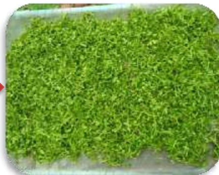
หั่นเป็นชิ้นๆ นำไปผึ่งลม