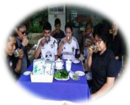
ชมชาพรมมิกันเถอะ