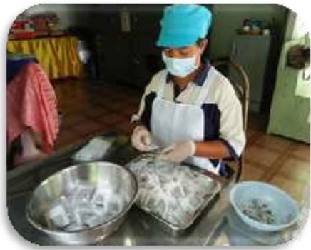
บรรจุซองเล็ก