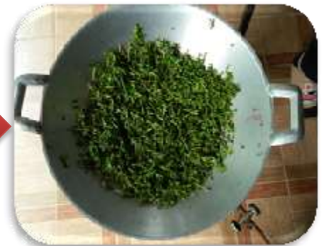
คั่วไฟอ่อนๆ