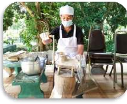
บดให้พอหยาบ