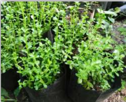
๔. พรมมิที่ปักชำเริ่มออกราก ๑ สัปดาห์