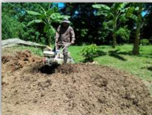
ผสมดิน, ปุ๋ยคอก, ขี้เถ้าแกลบคลุกเคล้ากัน

๑.๑ ดิน ใช้ดินร่วน, ปุ๋ยคอก, ขี้เถ้าแกลบ อัตราส่วน ๑ : ๑ : ๑ หรือจะใช้ดินพีทมอส ผสมกับขี้เถ้าแกลบ อัตราส่วน ๑ : ๑ : ๑ (พีทมอส มีคุณสมบัติอุ้มน้ำได้ดี ระบายอากาศได้ดี ทำให้ระบบรากของพืชเจริญเติบโตและแข็งแรง ตั้งตัวได้เร็ว) ได้เช่นกัน