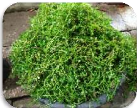
นำพรมมิมาล้างให้สะอาด