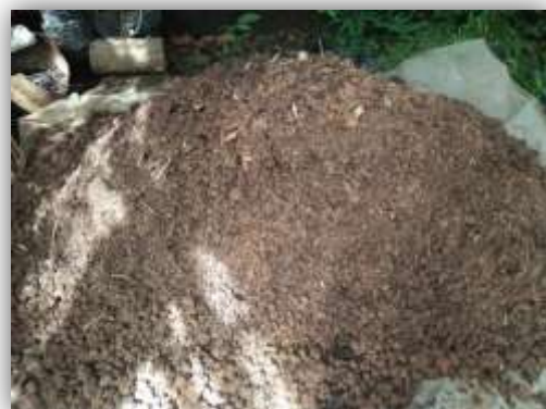
ดินผสมคลุกเคล้าเสร็จเรียบร้อยแล้ว