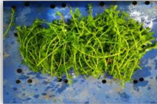
๒. ตัดกิ่งพันธุ์ยาว ๓ - ๔ นิ้ว